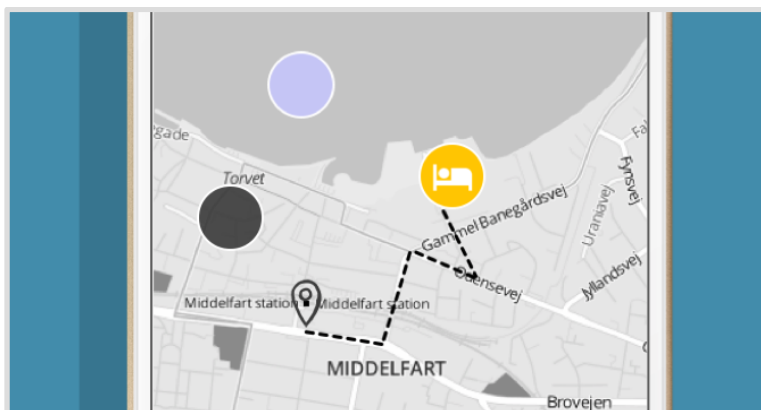
Billede 4: Visning af ruten til de respektive steder