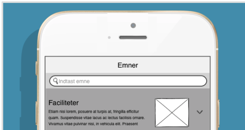
Billede 5: Søgning i filter/emne funktionaliteten