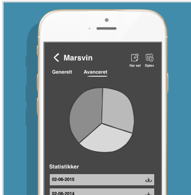
Billede 2: Indhold på fanen for de avancerede data